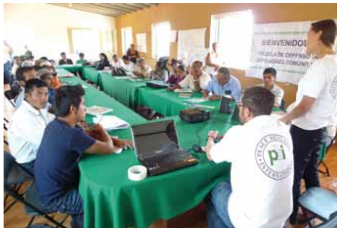
Miembros de PBI durante taller de seguridad impartido a defensoras y defensores comunitarios en Oaxaca

A pesar de estos logros, los números de agresiones a personas defensoras y de