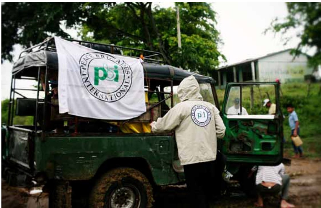
Una voluntaria camino de la finca La Europa. Montes de María, Sucre.