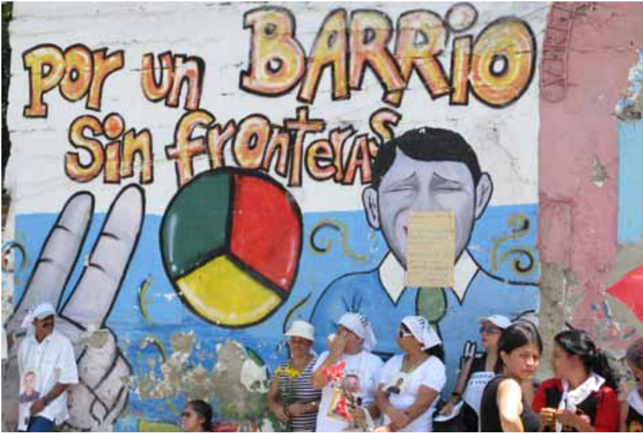
En mayo de 2011 PBI acompaña a ASFADDES y a la Corporación Jurídica Libertad en la caminata en memoria de las víctimas de desaparición forzada en la Comuna 13 (Medellín).