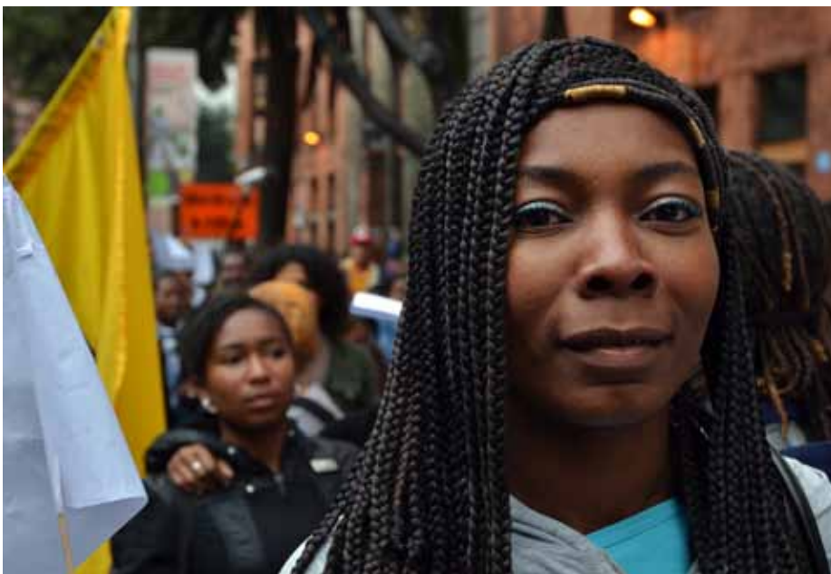
Una gran parte de las personas reclamantes de restitución de tierras son mujeres cabeza de hogar. Foto tomada durante la marcha por la afrocolombianidad en Bogotá en octubre de 2011.