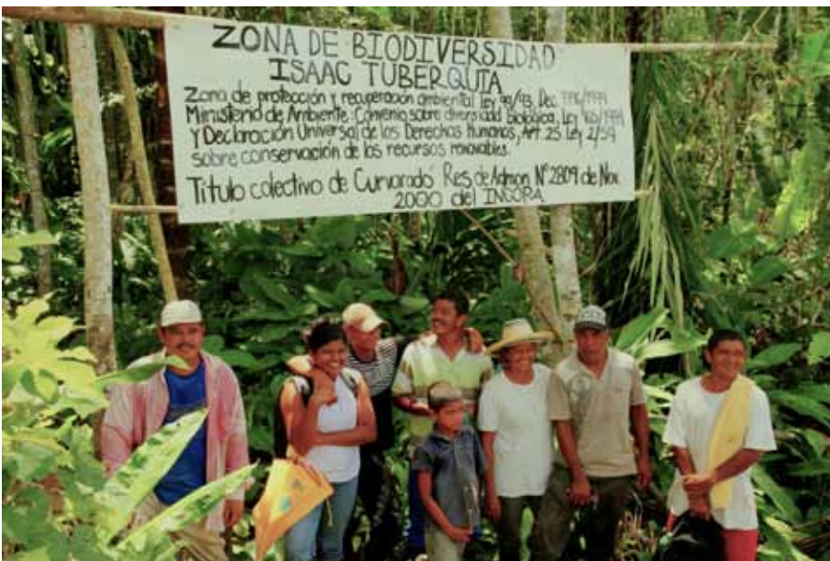
Una Zona de Biodiversidad en Curbaradó; zonas que han sido construidas para proteger el medio ambiente y la vida.