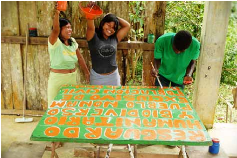
Mujeres indígenas Nonam. La CIJP acompaña y asesora a esta comunidad que fue desplazada en 2010 y retornó a su resguardo un año después.