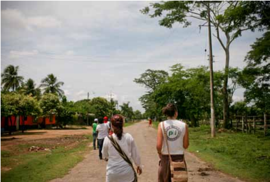
En septiembre de 2011, PBI recibió el premio de la Orden de San Pedro Claver de la Diócesis de Barrancabermeja otorgado a organizaciones que trabajan en la defensa y promoción de los derechos humanos.