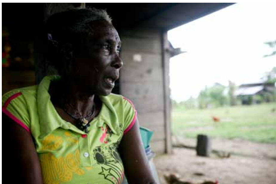
Mujeres del Chocó y Sucre. Fotos de la exposición sobre el tema de tierra y mujeres.