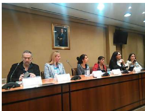
Acto con diputados y diputadas en el Consejo General de la Abogacía Española

También en el mes de mayo, desde PBI apoyamos la gira europea de la delegación del Consejo Cívico de Organizaciones Populares e Indígenas de Honduras (COPINH) en su paso por el Estado español. Como PBI participamos en Madrid en la reunión mantenida en el Ayuntamiento de Madrid y en la reunión con organizaciones de la Sociedad Civil. También organizamos un evento en el Consejo General de la Abogacía Española con la participación de diputados/as de 4 grupos parlamentarios. En la Comunidad Valenciana, participamos en una reunión de incidencia con la Vicepresidenta de la Generalitat Valenciana