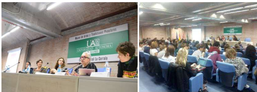
Imágenes del Seminario Internacional

Seminario Internacional de Alto nivel en el que participaron, además de mujeres defensoras de derechos humanos de Colombia, Honduras y México, personas expertas independientes de Naciones Unidas, académicas y expertas en derechos humanos, integrantes del Parlamento Europeo, representantes de organizaciones de la sociedad civil, junto a integrantes del cuerpo diplomático del MAEC y funcionarios de AECID implicados en las políticas públicas de promoción y protección de los derechos humanos, y de las políticas de cooperación internacional que contribuyen a la protección de mujeres defensoras y la construcción de paz.