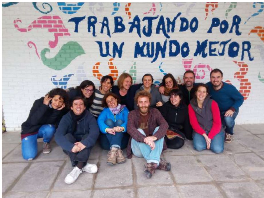
Integrantes de PBI en la Asamblea estatal en Noviembre de 2016