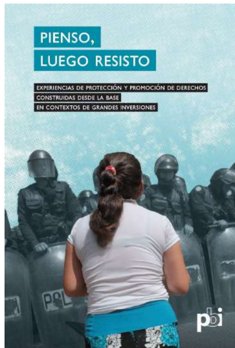
Imagen de la publicación "Pienso , luego resisto"

Las personas defensoras de derechos humanos son actores clave en el ámbito de las empresas y los derechos humanos. Debido al riesgo que enfrentan, PBI acompaña a diferentes comunidades, organizaciones y personas defensoras y decidió recopilar experiencias de protección y promoción de derechos humanos en estos contextos en una nueva publicación. Puede leerla en línea en: bit.ly/PiensoLuegoResisto