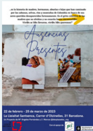
2023ko JARDUEREN MEMORIA NAZIOARTEKO BAKE BRIGADAK - ESPAINIAKO ESTATUA (PBI-EE)